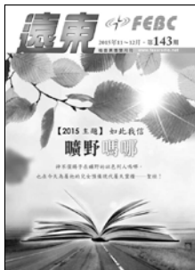
封面影像設計 | Zoe |